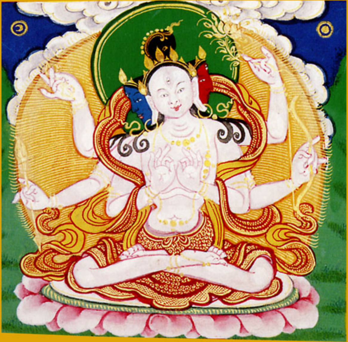
གཟུང་ཡུམ་རིག་པའི་ཀུལ་མོ་ 諸星曜母