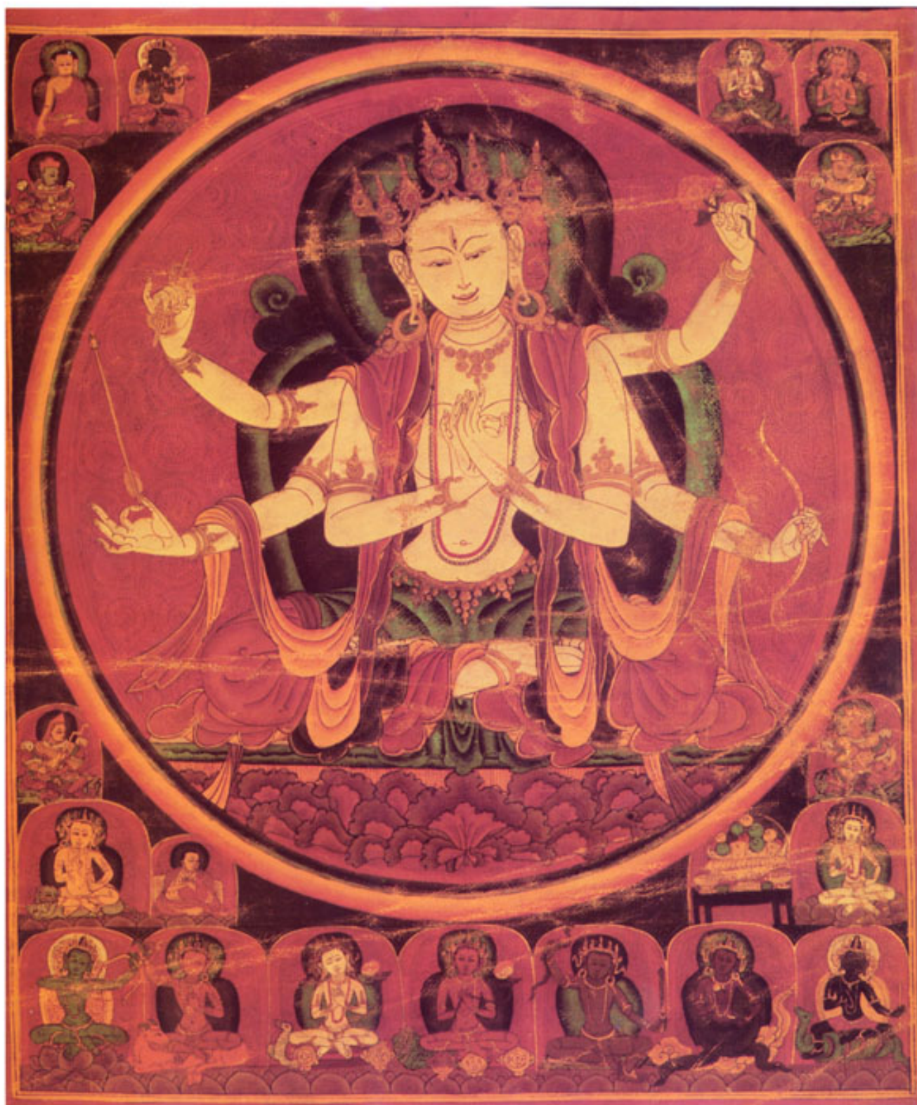
諸星曜母 (大明星母)