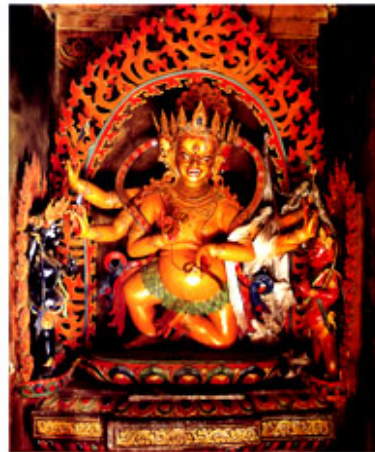
黃葉衣佛母 (江孜白居寺) 西藏博物館藏 攝於2010年