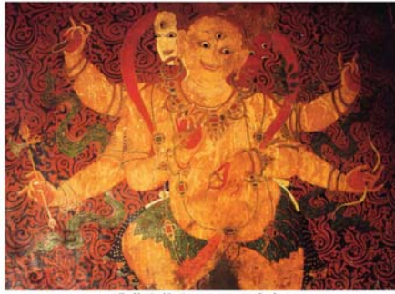
黃葉衣佛母 (江孜白居寺)