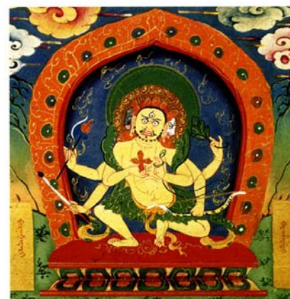
甘珠爾大藏經 - 葉衣佛母