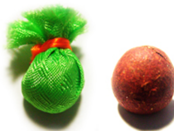
印度下密院(格魯派) 葉衣佛母藥丸

葉衣佛母有許多種不同的化相，例如黑葉衣母、藍葉衣母、綠葉衣母、黃葉衣母等，有的化相足踏屍墊，有些化相則沒有屍墊在腳下。這些許多現相不同的葉衣母，各有其傳承，但他們其實全是同一位本尊之不同化身，可是不同化身的葉衣母各有其咒，大家不宜混淆而修。』(右圖爲某位佛友贈予筆者之印度下密院—葉衣佛母藥丸)