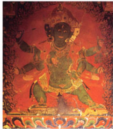
綠葉衣佛母 (江孜白居寺)