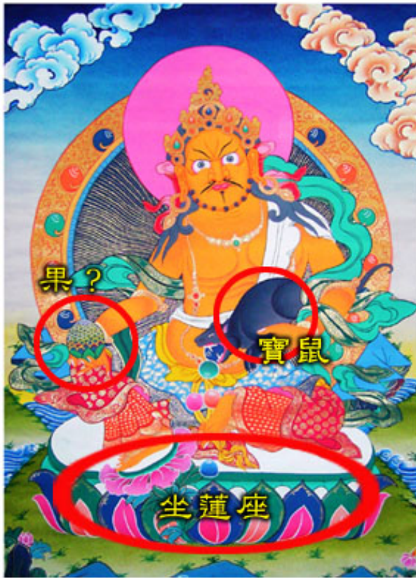
黃財神 ( 寶藏神 )

另有 財寶天王 ， 右手持寶傘 ， 左手於腰間持鼠 (其口咬寶珠)， 乘獅子 ，與黃財神是不一樣的！千萬別搞錯了！不過，藏傳佛教的本尊，實在是太多太複雜了，亦有財寶天王，是 右手持棒 ， 左手於腰間持鼠 (其口咬寶珠)，但卻是坐 蓮花座 ，而不是乘獅子的， 但最重要的是，財寶天王是寶藏神的八大眷屬之一 ，詳見本文之『五、寶藏神之八大眷屬』。